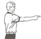
Doigt pointé parallèlement aux lignes de touche